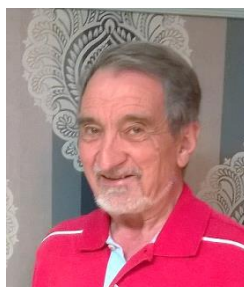
Guy Forget TACAE