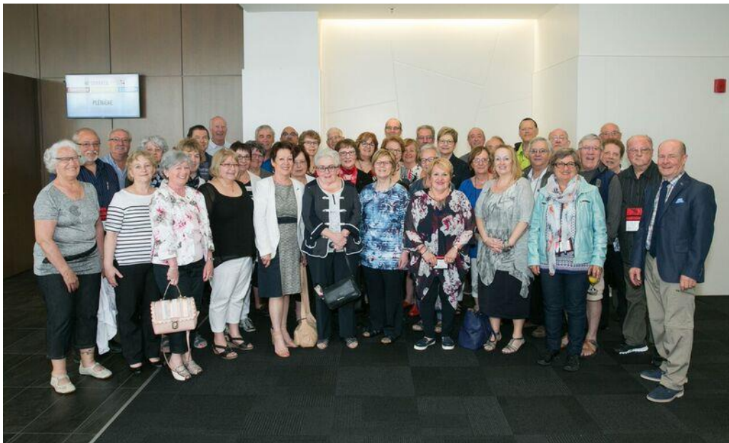
L'ensemble des membres de l'Estrie délégués au 46 e Congrès AREQ en mai 2017 à Lévis