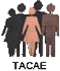
Table d'action contre l'appauvrissement de l'Estrie (TACAE)

LA CAMPAGNE UNITAIRE «ENGAGEZ-VOUS POUR LE COMMUNAUTAIRE»